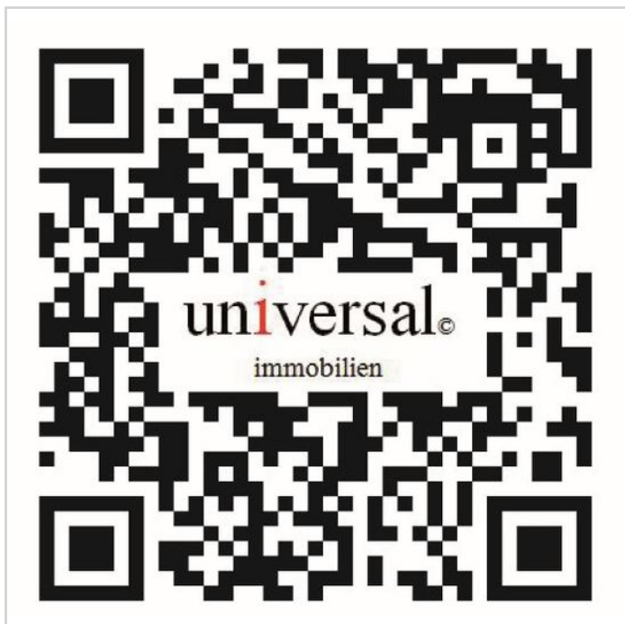
QR mit Logo.1

Zimmer: 1,00 Wohnfläche ca.: 42,27 m 2 Kaufpreis: 69.000,00 EUR